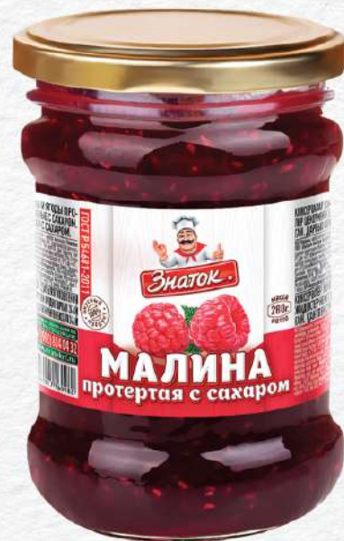
280г 12 ШТ МАЛИНА ПРОТЁРТАЯ С САХАРОМ ГОСТ Р 54681-2011 24 МЕСЯЦА