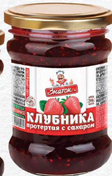
280г 12 ШТ КЛУБНИКА ПРОТЁРТАЯ С САХАРОМ ГОСТ Р 54681-2011 24 МЕСЯЦА