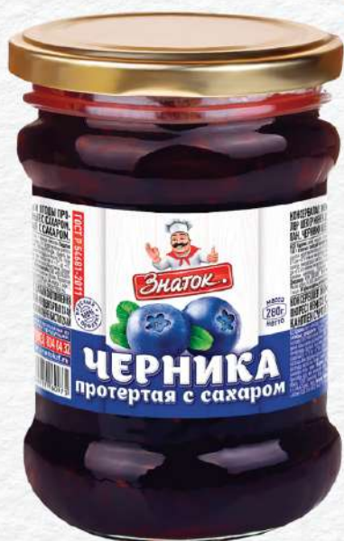
280г 12 ШТ ЧЕРНИКА ПРОТЁРТАЯ С САХАРОМ ГОСТ Р 54681-2011 24 МЕСЯЦА