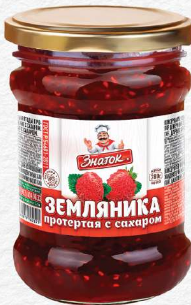
280г 12 ШТ ЗЕМЛЯНИКА ПРОТЁРТАЯ С САХАРОМ ГОСТ Р 54681-2011 24 МЕСЯЦА