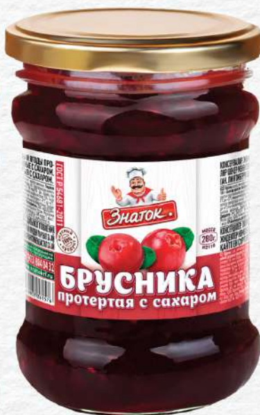
280г 12 ШТ БРУСНИКА ПРОТЁРТАЯ С САХАРОМ ГОСТ Р 54681-2011 24 МЕСЯЦА