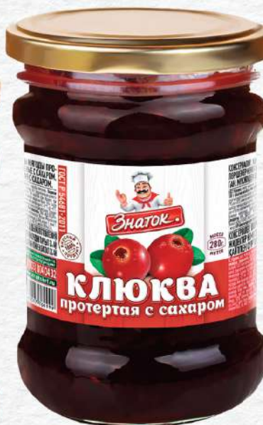
280г 12 ШТ КЛЮКВА ПРОТЁРТАЯ С САХАРОМ ГОСТ Р 54681-2011 24 МЕСЯЦА